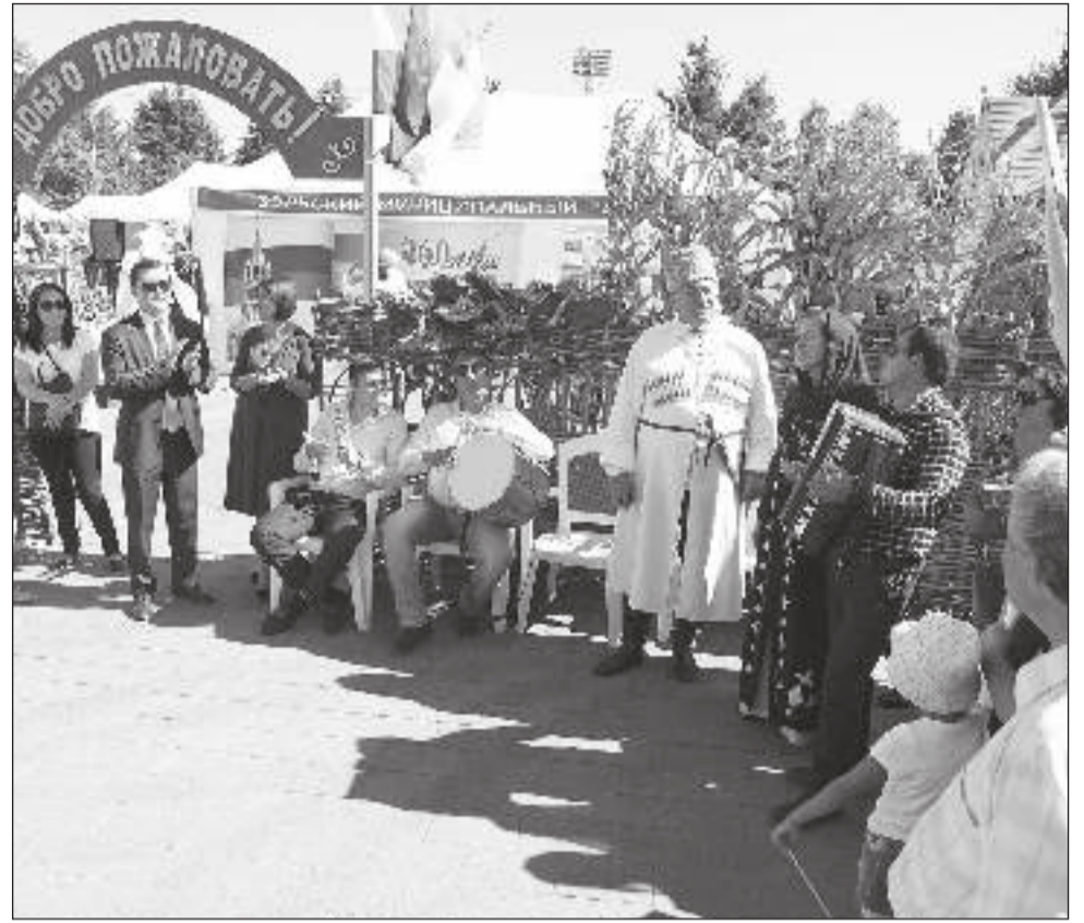
Обширное участие в празднике приняло всё муниципальное сообщество республики. Павильоны всех 13 городских округов и муниципальных районов приняли гостей из других регионов, угощали национальными блюдами народов Кабардино-Балкарии.